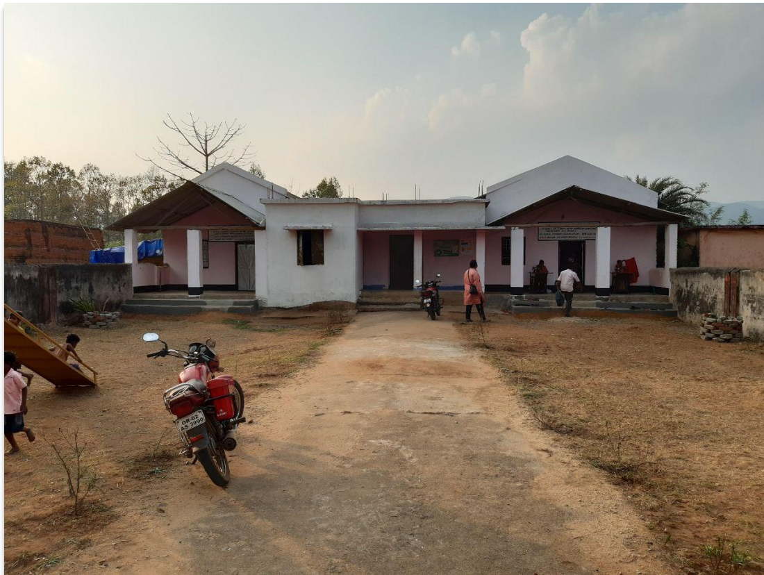
Anbau von zwei neuen Unterrichtsräumen und Umbau des bestehenden Gebäudes