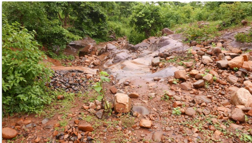
Flusslauf: Selbst in der Regenzeit fließt hier nicht immer Wasser.

Durch die neu erschlossene Wasserquelle sind die Bewohner nicht mehr von der ungenügenden und gefährlichen Quelle abhängig. Der neue Brunnen verfügt über einen 5000-Liter-Wassertank, welcher mit einer solarbetriebenen Pumpstation die Trinkwasserversorgung im Dorf sichert. Das Dorf verfügt über drei Bezugsstellen. Die von Children – Care & Development finanzierten Brunnenprojekte bieten den Mankidias eine sichere Wasserversorgung und bedeuten eine grosse Erleichterung für sie.