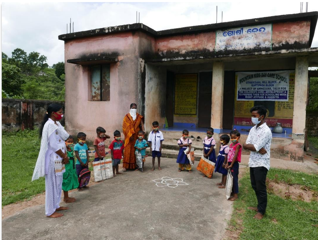
Altes Gemeindehaus. Umnutzung als Tagesschule für Anwesana