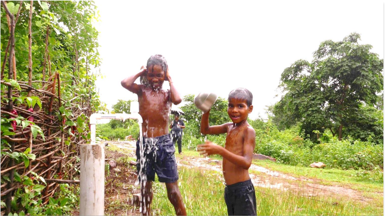
Sich täglich duschen macht nicht nur spass, sondern beugt auch Hautkrankheiten vor.